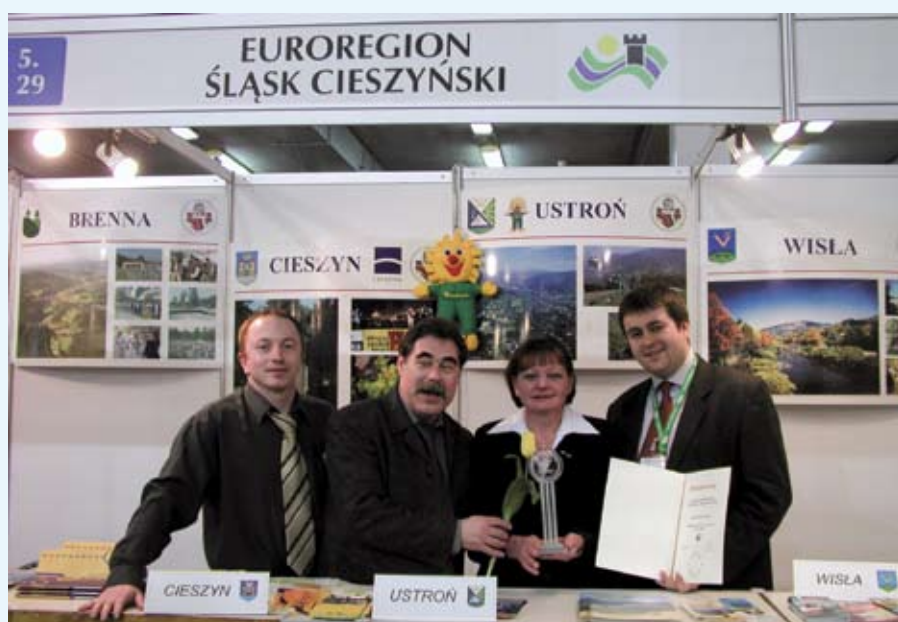
Reprezentanci gmin z nagrodą